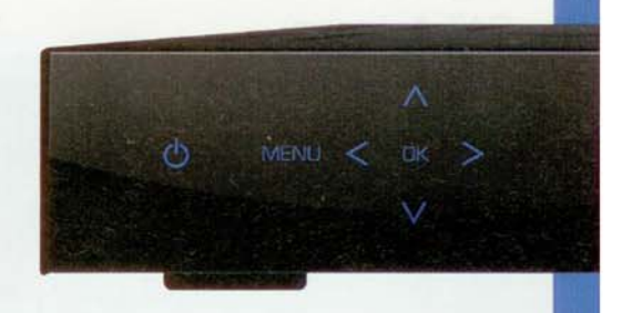
Der HDTV-Receiver des Herstellers Vantage kann in Unicable Empfangsanlagen genutzt werden. Er verfügt über einen Twin-Tuner sowie CI-Schächte für Pay-TV und ist damit optimal einsetzbar. Das Gerät wird ohne Festplatte für etwa € 500, - angeboten.

Single-Receiver angeschlossen werden oder maximal vier Twin-Receiver. Da an jeder Antennendose nur ein Anschluss existiert, ist für ein Twin-Receiver ein Verteiler mit zwei Ausgängen an der Antennendose notwendig.