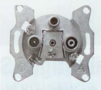
Die für das Unicable System erforderlichen Antennendosen müssen den Frequenzbereich bis 2200 MHz unterstützen und zudem gleichstromentkoppelt sein. Entsprechende Antennendosen sind ab € 10,- im Fachhandel erhältlich.